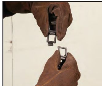
Cadena ajustable para varios diámetros