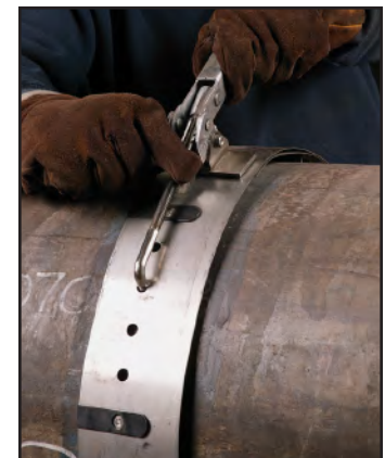
Sistema de fijación rieles guías