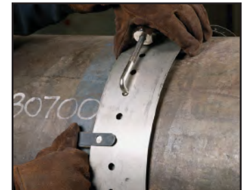
Ajustes de rieles guía