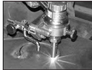
Adit. Corte Círculos Pequeños 30-120mm (1 1/4 - 4 1/2 in)