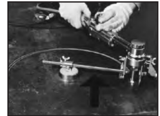
Adit. Corte Círculos Extra grandes 120-1000mm (5-40 in)