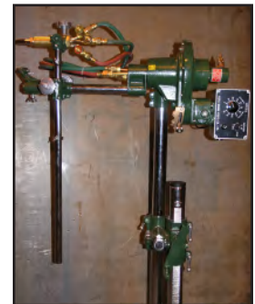
Corte Inclinado de Plancha