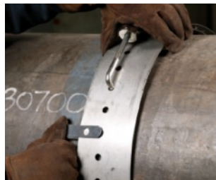
Ajuste para sobreposição do trilho guia