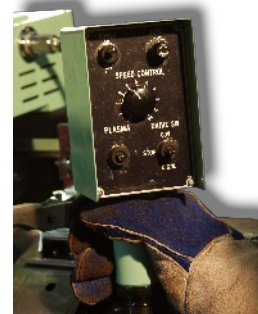
Controle Remoto: permite o controle seguro longe da peça

A Auto Picle P -Modelo S permite chanfro e corte reto com alta precisão.