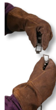
Ajuste dos elos da corrente para diversos diâmetros