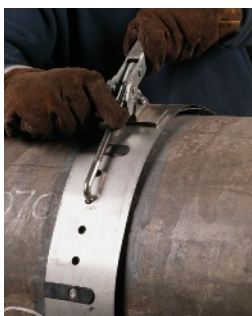
Trava da sobreposição do trilho guia

O trilho guia faz da Auto Picle P -Modelo S particularmente adequada para tubos de grandes dimensões. Inúmeros profissionais, incluindo fabricantes, empresas de sucata, fabricantes de caldeiras e fabricantes de tanques estão usando a máquina de corte de tubos da Koike com sucesso.