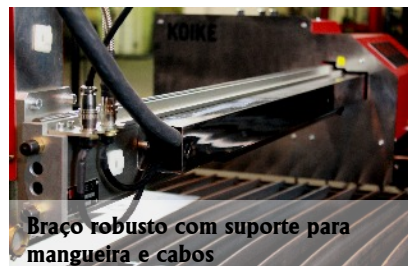
Braço robusto com suporte para mangueira e cabos