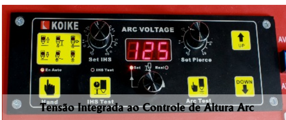
Tensão Integrada ao Controle de Altura Arc