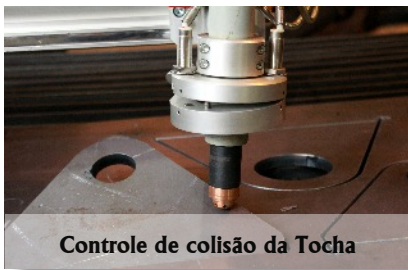
Controle de colisão da Tocha