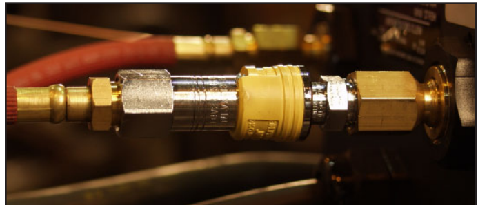
Manguera a Equipo