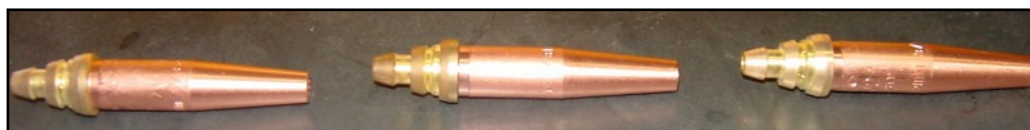
Boquillas De Corte Koike Aronson