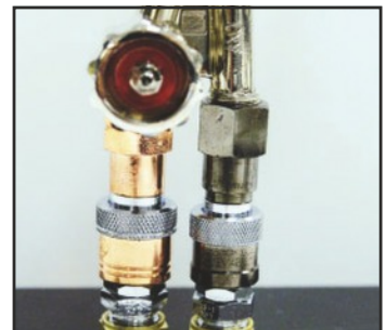
Sets Safety-Z y Acoples Super Sentinel

Reguladores Personalizados - Los reguladores de una etapa Koike 101 para oxígeno, 202 para acetileno y 206 para LPG, cumplen con los requerimientos de la industria, son livianos y económicos. Cerciórese que sus operaciones de corte, soldadura y precalentamiento sean seguras y eficaces con los reguladores Custom de Koike.