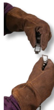
Ajustando los eslabones de cadena para diferentes diametros