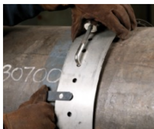
Ajustando el Riel Guia