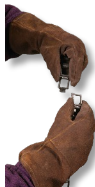
Cadena ajustable para varios diámetros

Control Remoto permite un control seguro lejos de la pieza de trabajo evitando salpicaduras