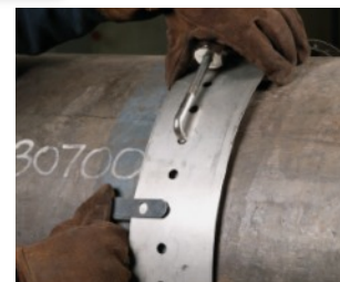
Ajustes de rieles guía