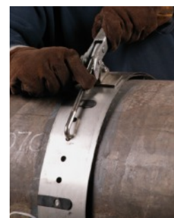
Sistema de fijación rieles guías