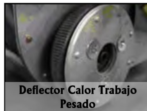
Deflector Calor Trabajo Pesado