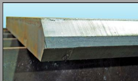
Detalle Doble Bisel V