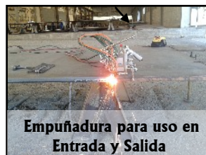
Empuñadura para uso en Entrada y Salida