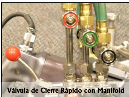
Válvula de Cierre Rápido con Manifold